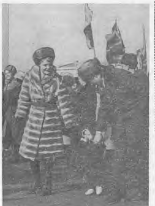
На демонстрации.