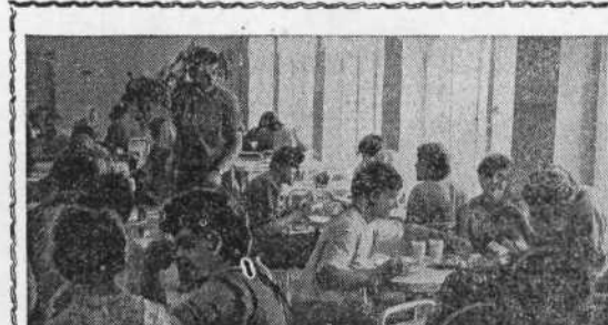
В этой большой светлой столовой трижды в день собирается все студенческое население учхоза.