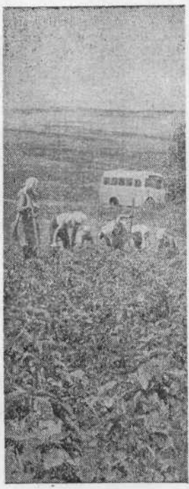
ДЛЯ студентов нашего института учебно-опытное хозяйство является местом настоящей трудовой закалки.

Своими руками будущей агрономы, ветврачи, инженеры, зоотехники обрабатывают почву, выращивают и убирают хлеб, овощи, фрукты, здесь учатся они водить сельскохозяйственные машины, ухаживать за растениями и животными, занимаются научно-исследовательской работой.